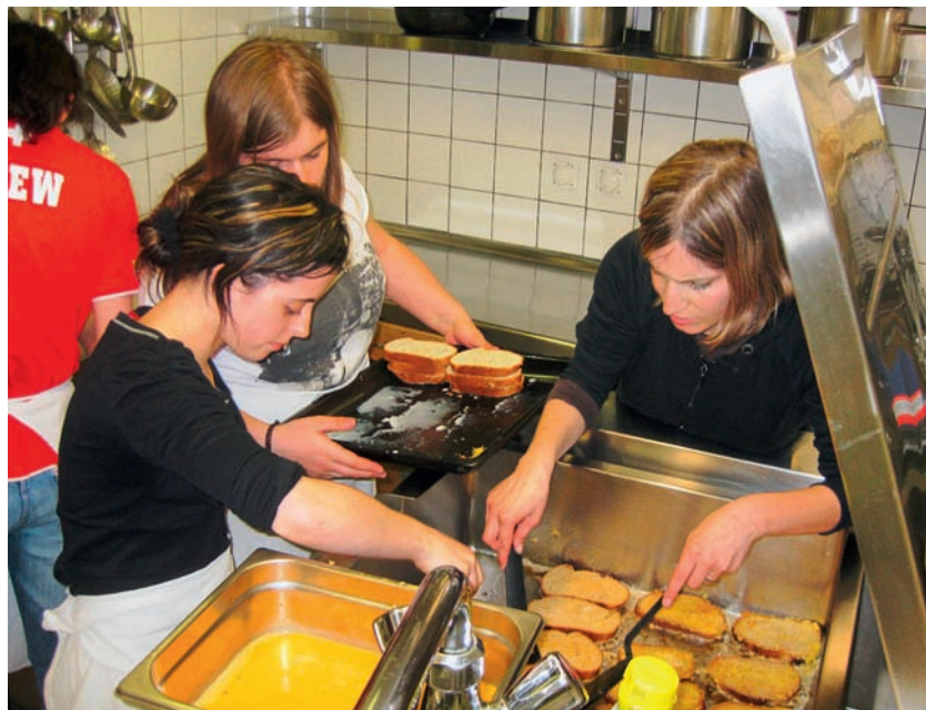
Auch bei der Küchenarbeit wurde tatkräftig mitgearbeitet.

lenbad gehen, zum Shoppen nach Chur fahren, wandern oder einfach nur im und ums Lagerhaus bleiben wollten. Es erstaunt eigentlich nicht, dass niemand an der Wanderung teilnehmen wollte ... Trotz Muskelkater, kurzen Nächten und auch mal einem Regenguss waren die Lernenden begeistert von der Woche. Sie hatten die Zusammenarbeit, das Lagerleben und die gute Stimmung genossen und waren stolz auf ihre Leistung. Die lobenden Gästebucheinträge von Kollegen, Kolleginnen und Vorgesetzten von der «palme» sowie von Freunden und Bekannten auf der eigenen Lager-Website wurden immer wieder gerne gelesen.