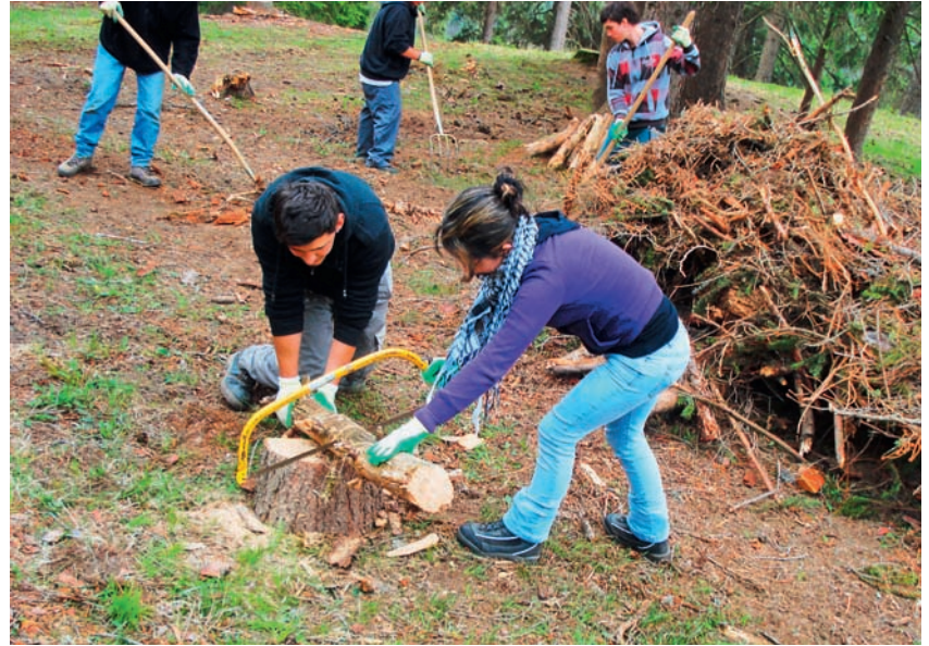
Auch eine Säge kam zum Einsatz.

Nach dem Mittagessen durften die Lagerteilnehmer wählen, ob sie ins Hal-