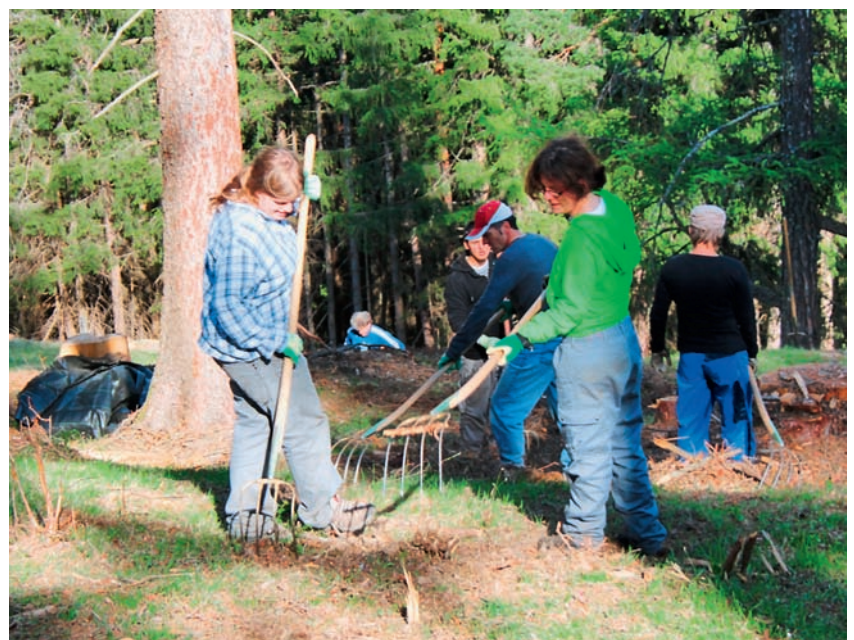
Miteinander geht es viel leichter.